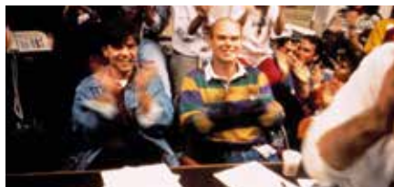
The War Room D. A. Pennebaker, Chris Hegedus Stati Uniti, 1993, 96'

Coppia artistica e nella vita, Chris Hegedus e D.A. Pennebaker sono conosciuti per il loro stile incisivo di cinema verità. Tra i più importanti documentaristi americani, raccontano la campagna di Bill Clinton durante le elezioni presidenziali del 1992.