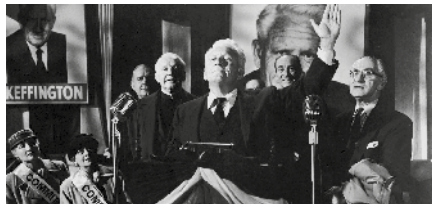
The Last Hurrah John Ford Stati Uniti, 1958 Cast S. Tracy, J. Hunter, D. Foster, P. O'Brien

Tra i più grandi registi della storia del cinema. Per la storia de L'ultimo urrà! ha tratto ispirazione dalla vita del sindaco di Boston James M. Curley, dandogli le fattezze di Spencer Tracy.