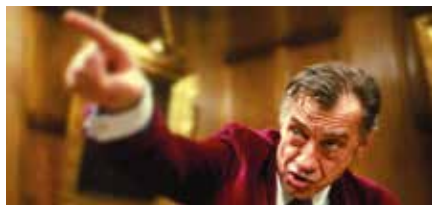
Secret Honor Robert Altman Stati Uniti, 1984, 90' Cast Philip Baker Hall

I suoi film raccontano un'America 'amara', segnata da un senso di nostalgia e animata da una critica disincantata. Altman, immagina un lungo monologo immaginario di Nixon giunto a fine carriera.