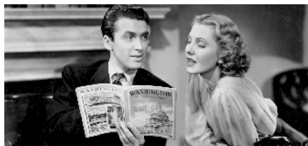
Mr. Smith Goes to Washington Frank Capra Stati Uniti, 1939, 129' Cast J. Stewart, J. Arthur, C. Rains, E. Arnold

20/10 Casa del Cinema 21:00 Ingresso libero